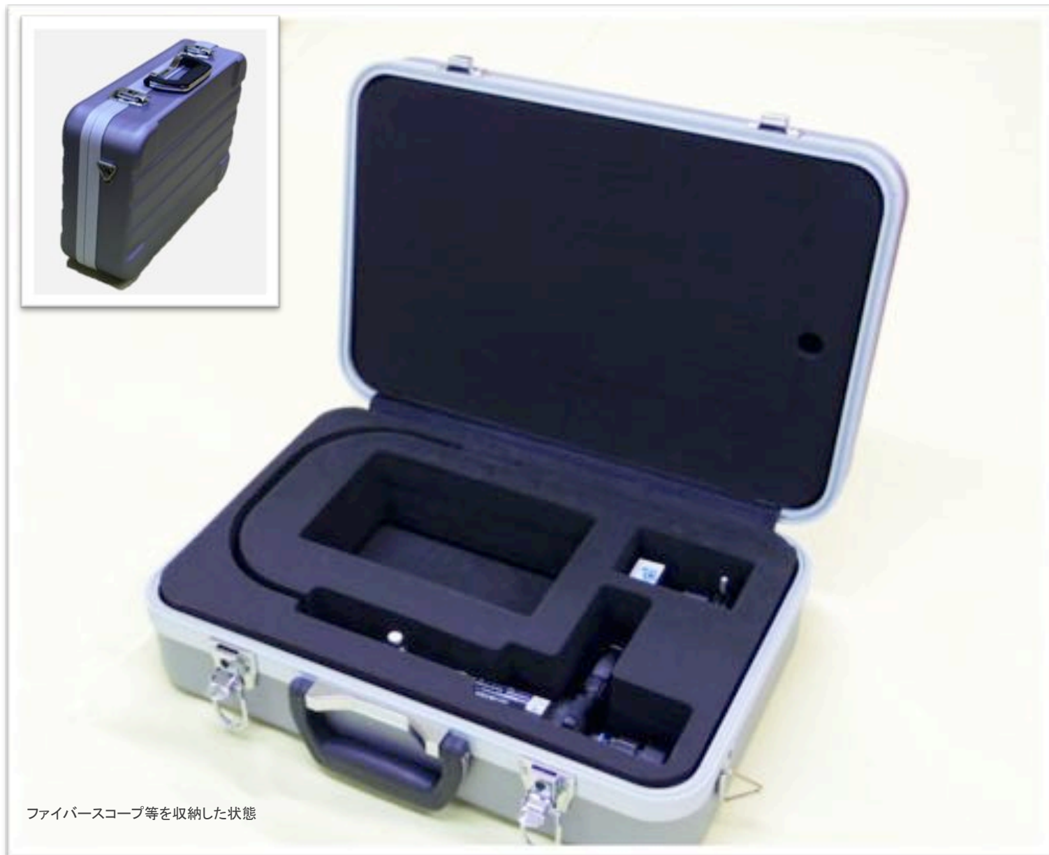
ファイバースコープ等を収納した状態