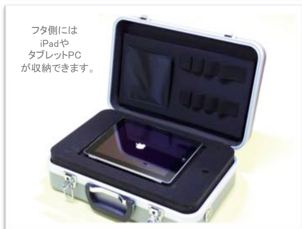
フタ側には iPadや タブレットPC が収納できます。