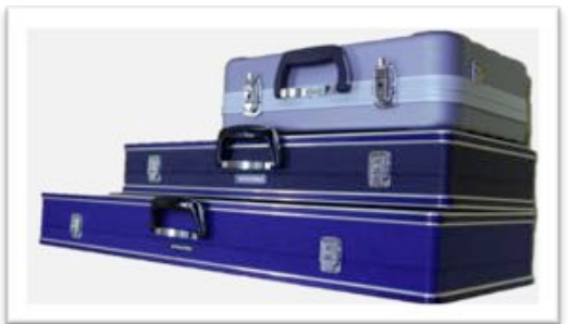
純正ケースとの比較